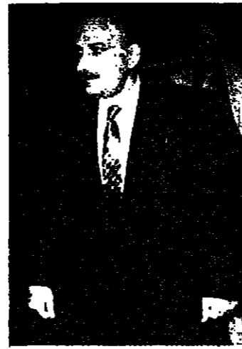
الرئيس الحسيني لدى مغادرته

عرض رئيسا الجمهورية والمجلس النيابي الشيخ أمين الجميل وحسين الحسيني في اجتماعهما الأسبوعي مساء امس الذي استمر من الساعة السادسة حتى الساعة والربع الأوضاع الامنية والسياسية والاقتصادية. واعتبر الرئيس الحسيني ان قرار ارسال الجيش الى الجنوب هو قرار استراتيجي لا تغيير ولا تبديل فيه. وان لجوء اسرائيل الى تصورياها بغنا ضد قوات الطوارئ الدولية امر غير صحيح ويعارض مع واقع الامر.